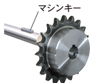
KANAマシンキーを併せてご利用ください。 P436-437参照